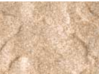
KS 03 rosé