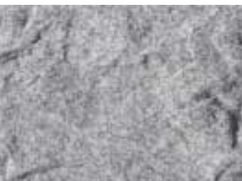
KS 05 anthrazit