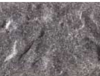
KS 06 grau