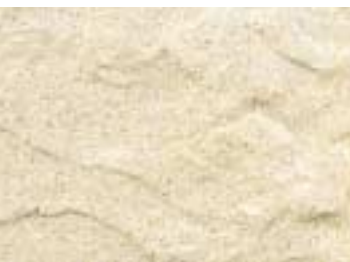
KS 02 gelb