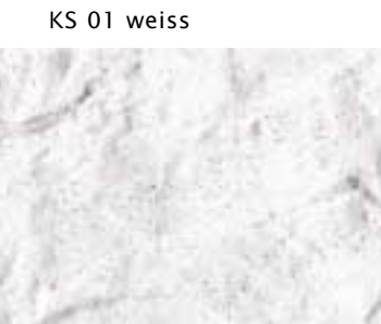
KS 01 weiss